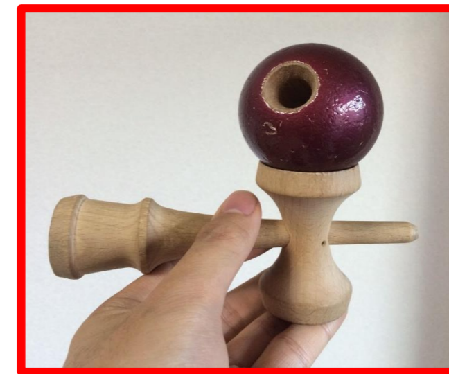
大皿ストライクの失敗例